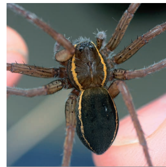
DOLOMÈDES PLANTARIUS ( Dolomedes plantarius )

Ce campagnol est localement présent en France, en Espagne et au Portugal où il fréquente les berges des cours d'eau et de zones humides. Sa présence dans les marais de Sacy, qui représentent la limite nord de son aire de répartition, a été confirmée en 2015 grâce à l'analyse génétique de crottes avec une répartition qui reste encore à définir.