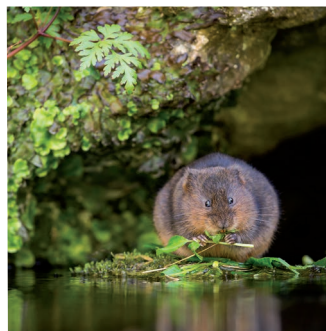
CAMPAGNOL AMPHIBIE ( Arvicola sapidus )

Les populations de ce très petit escargot sont surtout situées en Europe méridionale, en Europe centrale et en Europe de l'ouest. Il fréquente les zones humides de bonne qualité. Les marais de Sacy constituent un des bastions de cette espèce au niveau régional.