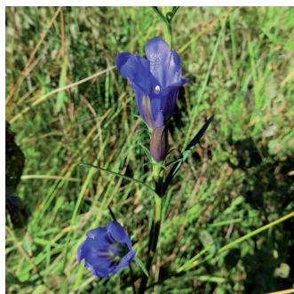
GENTIANE PNEUMONANTHE ( Gentiana pneumonanthe )

Cette gentiane de plaine fréquente les prairies et marais sur des sols riches en matière organique à tourbeux et humides à temporairement inondés en surface. Dans le nord-ouest de la France, elle est uniquement présente dans quelques marais à l'intérieur des terres dans la Somme (autour d'Amiens), l'Oise (marais de Sacy) et dans l'Aisne (Laonnois et Tardenois).