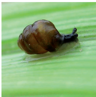
VERTIGO DE DES MOULINS ( Vertigo moulinsiana )

Cette gentiane de plaine fréquente les prairies et marais sur des sols riches en matière organique à tourbeux et humides à temporairement inondés en surface. Dans le nord-ouest de la France, elle est uniquement présente dans quelques marais à l'intérieur des terres dans la Somme (autour d'Amiens), l'Oise (marais de Sacy) et dans l'Aisne (Laonnois et Tardenois).