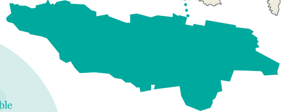
Les marais de Sacy