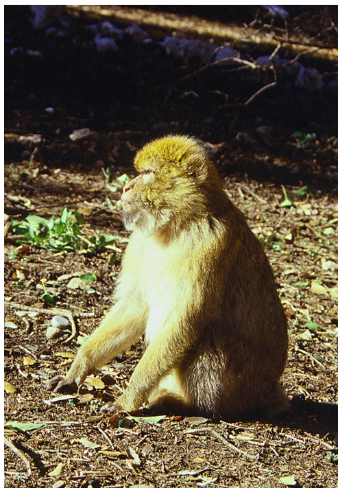
Foto 1 Aspecto de una mona de Berbería, este ejemplar corresponde a los que se aproximan a pedir alimento a los turistas en el cedral de Azrou en el Medio Atlas, Marruecos.

Photo 1 Physical aspect of a Barbary macaque, this individual corresponds to those that approach tourists to request food in the cedars of Azrou in the Mid Atlas, Morocco.