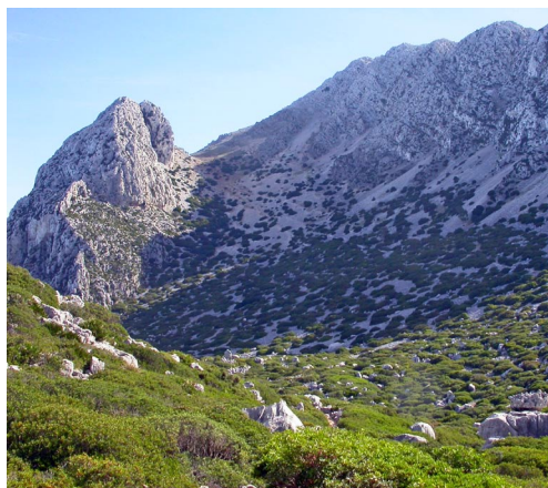
Foto 3 Aspecto distintivo de este macizo calizo, donde se puede observar la amplitud de sus escarpes rocosos y el aspecto de la vegetación dominante, una de las zonas seleccionada por la mona de Berbería.

Photo 3 Distinctive aspect of this calcareous massif, where the extensive rocky escarpes and dominant vegetation are visible, one of the areas selected by the Barbary macaque.