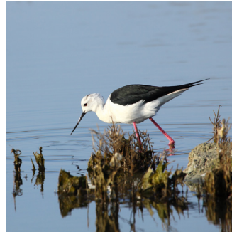
ÉCHASSE BLANCHE ( Himantopus himantopus )

La Zostère naine est une plante à fleur marine qui se développe sur l'estran vaseux au cœur du Fier d'Ars. Elle fleurit entre juin et septembre, et s'ancre dans le sédiment grâce à son rhizome. Elle forme un herbier assez dense créant ainsi un habitat favorable à de nombreuses espèces pour leur reproduction, mais aussi une ressource alimentaire importante pour de nombreux oiseaux.