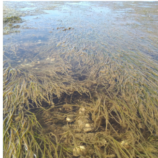
ZOSTÈRE NAINE ( Zostera noltii )

Le Pélobate cultripède est un amphibien dodu d'une dizaine de centimètres au maximum. Sa principale particularité physique est la présence de tubercules noirs sous ses pattes arrière appelés couteaux, qui lui permettent de creuser pour s'enfouir dans le sol. On le reconnaît aussi à ses yeux saillants et à son chant particulier, qui ressemble à un caquètement. Le site du Fier d'Ars a l'une des plus belles populations de la façade atlantique estimée à près de 450 individus.