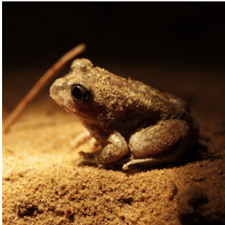
PÉLOBATE CULTRIPÈDE ( Pelobates cultripes )

Le Pélobate cultripède est un amphibien dodu d'une dizaine de centimètres au maximum. Sa principale particularité physique est la présence de tubercules noirs sous ses pattes arrière appelés couteaux, qui lui permettent de creuser pour s'enfouir dans le sol. On le reconnaît aussi à ses yeux saillants et à son chant particulier, qui ressemble à un caquètement. Le site du Fier d'Ars a l'une des plus belles populations de la façade atlantique estimée à près de 450 individus.