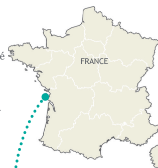
Marais du Fiers d'Ars

Ce site Ramsar est situé au Nord-Ouest de l'île de Ré, à cheval sur les communes de Loix, La Couarde-sur-Mer, Ars-en-Ré, Saint-Clément-des-Baleines et Les Portes-en-Ré.