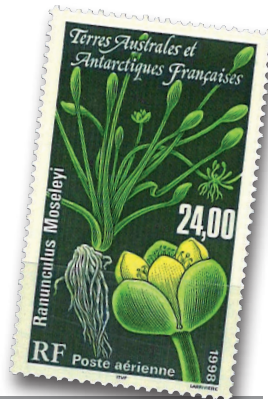
RANUNCULUS MOSELEYI ( Ranunculus moseleyi )

Cet albatros est endémique de l'île Amsterdam. Sa nidification est restreinte au Plateau des tourbières dans les hauteurs de l'île. Bien qu'en progression, la population de l'albatros d'Amsterdam reste à des niveaux très bas avec seulement 30 à 40 couples reproducteurs chaque année.