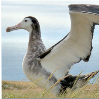
ALBATROS D'AMSTERDAM ( Diomedea amsterdamensis )

Endémique des archipels Crozet et Kerguelen, le canard d'Eaton est présent en hiver dans les zones humides côtières ou insulaires pour y occuper les prairies côtières avec plans d'eau peu profonds. En été, les individus se dispersent dans les terres et occupent une grande variété d'environnements humides (cours d'eau, lacs, mares, prairies humides, etc.).