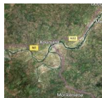
Vue aérienne du fleuve Niger à Koumana - Kouroussa ( Image Guinée, 25-01-2014 )

Fournir au moins une photographie du site: