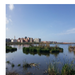
Merja Fouwarate