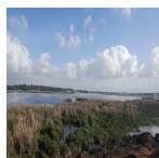
Merja Fouwarate